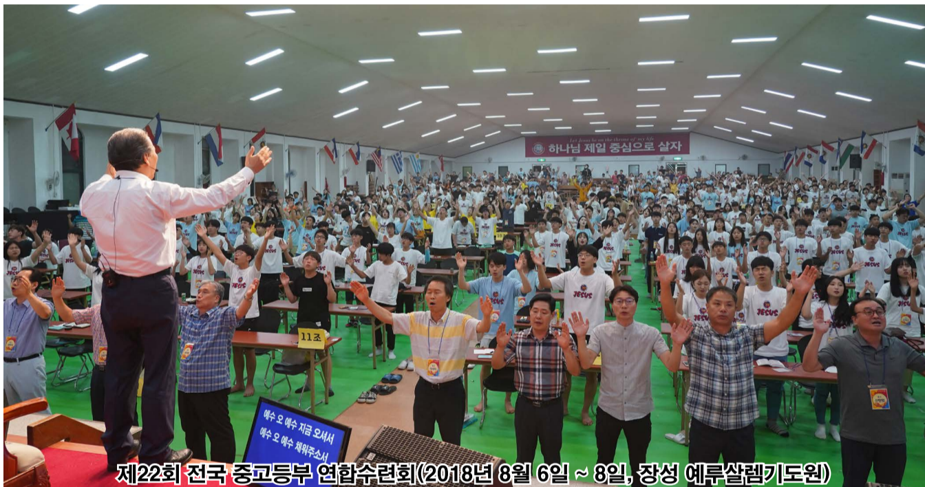
제22회 전국 중고등부 연합수련회(2018년 8월 6일 ~ 8일, 장성 에루살렘기도원)

지금 부지런히 공부하라. 지금 부지런히 배워라. 지금 부지런히 하나님을 섬겨라. 지금 부지런히 너의 달란트를 찾아라. 오