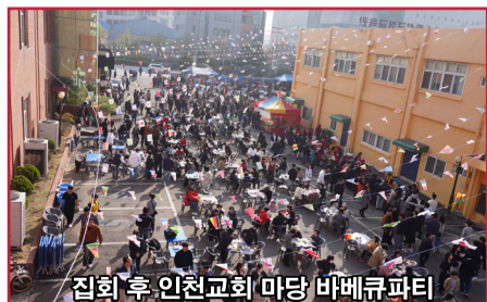
집회 후 인천교회 마당 바베큐파티