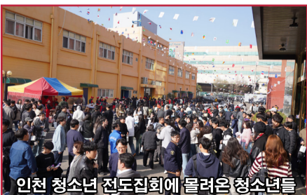
인천 청소년 전도집회에 몰려온 청소년들