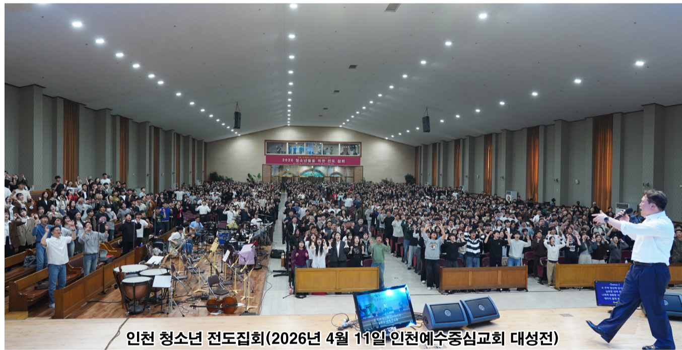
인천 청소년 전도집회(2026년 4월 11일, 인천예수중심교회 대성전)

오늘 처음 교회에 오신 분들도 마찬가지입니다. 성경에는 늦게 된 자가 먼저 될 수 있다고 하셨습니다. 오늘 마음의 문을 여는 순간 빛이 들어옵니다. 예수님이 찾아오십니다. 그러면 만사가 풀립니다. 그분께 아뢰세요. '하나님, 나 힘들어요.', '하나님, 길이 안 보여요.', '하나님, 내게 살아갈 소망을 주세요.' 그렇게 아뢰세요. 그러면 저에게 찾아와 삶을 변화시키신 하나님이 여러분의 삶도 변화시키실 것입니다. 하나님은 지금도 살아계십니다. 그리고 그 살아계신 예수님은 지금, 이 순간에도 우리를 부르고 계십니다." 이월드 목사의 진솔한 간증은 힘든 시대를 살아가는 젊은이들의 심금을 울려 여기저기서 울음소리가 들려왔다. 그들의 상한 심령을 하나님이 위로하고 해결하