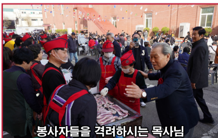
봉사자들을 격려하시는 목사님