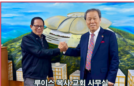
루이스 목사 교회 사무실