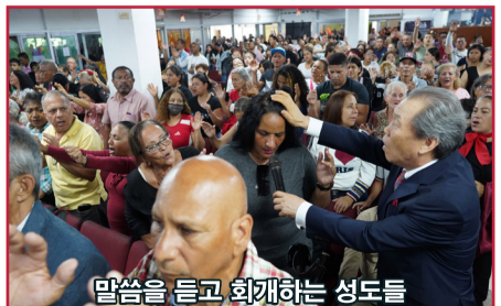
말씀을 듣고 회개하는 성도들