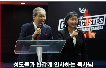
성도들과 반갑게 인사하는 목사님