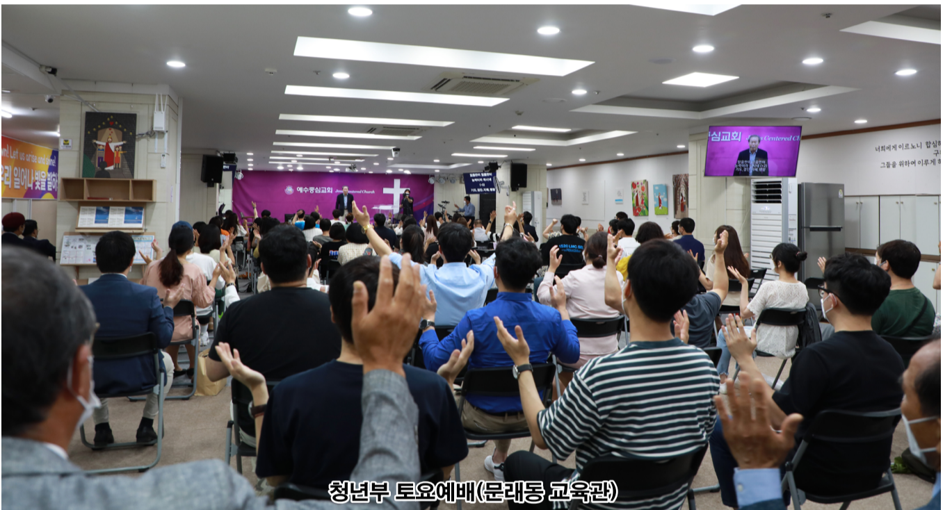
청년부 토요일예배(문래동 교육관)

나는 오늘 이 말씀을 전하기 위해 5시간 기도하고 왔단다. 나는 분명히 너희를 성공시킬 자신도, 능력이 있단다. 내 말을 듣고 행동으로 옮기면 너희는 분명